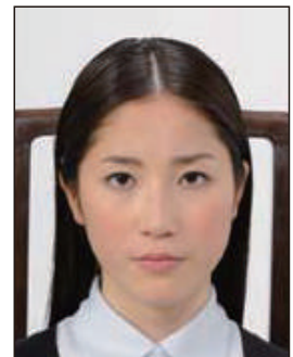
椅子等背景があるもの