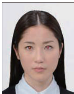
顔がフラッシュ等により赤く写ったもの