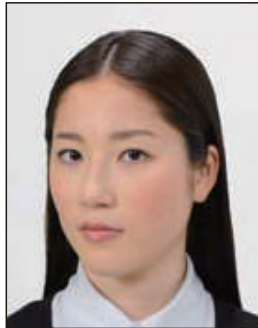
顔が横向きのもの