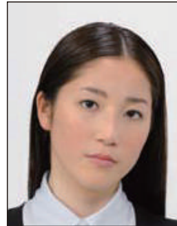
顔が左右に傾いているもの