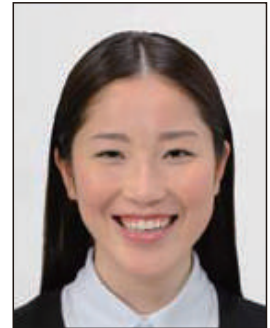
平常の顔貌と著しく異なるもの