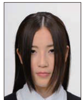
前髪が長すぎて目元が見えないもの 顔の輪郭が隠れるもの