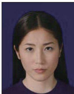
背景の色がきつく人物を特定しづらいもの