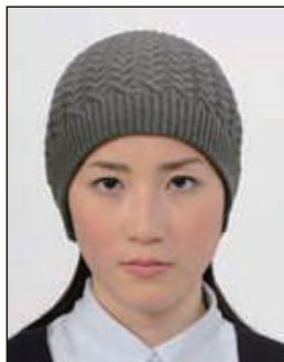
帽子によって頭部が隠れているもの