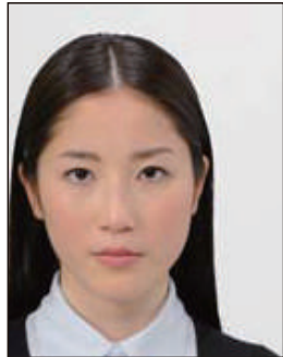
顔の位置が片寄っているもの