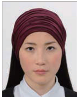
幅の広いヘアバンド等により頭部が隠れているもの