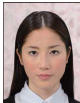
背景に柄があるもの